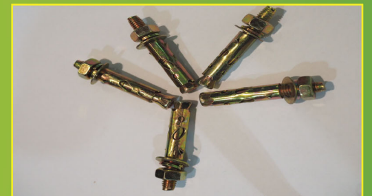
พุกเหล็กทองเหลือง 3/8